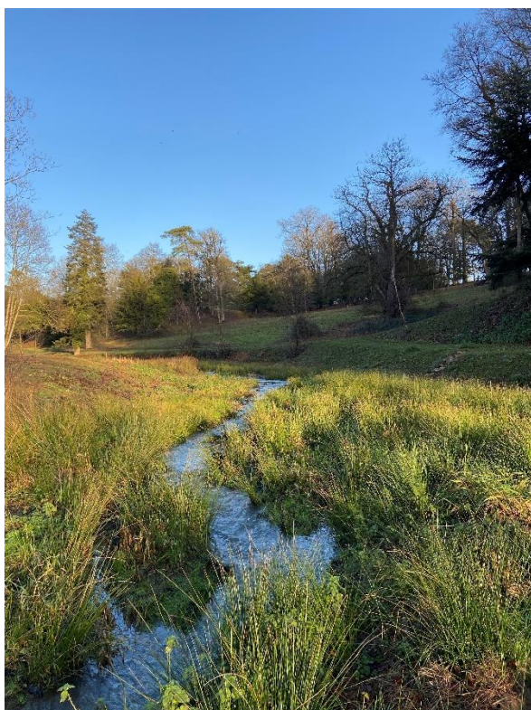
Parc des Hunaudières, 10 janvier 2023