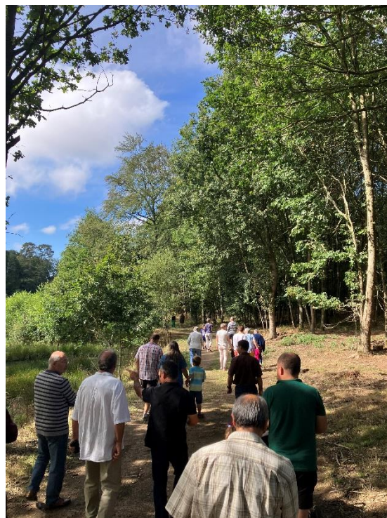
Parc des Hunaudières, 2 septembre 2023

En 2022-2023, le Syndicat du bassin de l'Oudon a réalisé des travaux, en concertation avec la commune, sur le ruisseau de La Ridelais (affluent du Chéran), à Saint-Saturnin-du-Limet, en lieu et place du plan d'eau des Hunaudières.