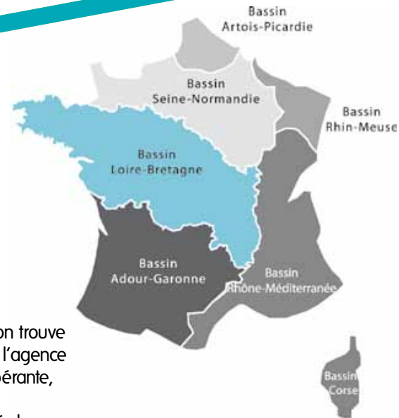
La France continentale est divisée depuis 1964 en bassins hydrographiques

La gestion française de l'eau permet d'associer les usagers et de prendre en compte la particularité de chaque bassin.