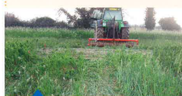
Destruction de couverts par roulage

Dans le cadre de l'élaboration du 5 ème programme de la Directive Nitrates, la destruction des couverts végétaux fait l'objet de discussions. Dès la campagne 2013-2014, la destruction chimique sera probablement limitée aux parcelles en TCS (Techniques Culturelles Simplifiées). En l'absence de solution chimique, il sera nécessaire de choisir des espèces gélives ou sensibles à la destruction mécanique (roulage ou scalpage). Au-delà du choix de l'espèce, les expérimentations conduites sur la destruction des couverts par roulage ont mis en évidence que les couverts développés étaient les plus sensibles au roulage et au gel. D'où l'importance de semer tôt !