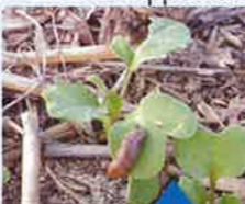
Attaque de limace sur jeune colza

Les concentrations élevées de métaldéhyde enregistrées cette année sont liées à l'imprécision de certains matériels d'épandage (projection directe des granulés dans les cours d'eau bordant la parcelle) mais surtout aux importantes précipitations de mi-septembre à fin octobre 2012. Cette pluviométrie a favorisé le fort développement des populations de limaces et entraîné le retard des semis et/ou le ralentissement de la levée des cultures. Colzas et céréales d'hiver ont donc vu leur période de sensibilité aux limaces augmenter. De plus, les déchaumages du mois d'août réalisés dans le sec n'ont pas permis la destruction des populations de limaces initialement présentes, ce qui a aidé à leur développement.