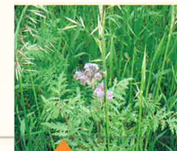
Mélange phacélie et avoine brésilienne

En conclusion, pour tirer un maximum de bénéfices des couverts, une vraie réflexion doit s'engager, autour de l'itinéraire technique à commencer par l'implantation et le choix de l'espèce.