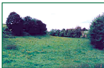
Parcelle riveraine en prairie avec ripisylve et talus en rupture de pente.

Les haies sur talus implantées en rupture de pente, contribuent à la régulation des eaux, à la conservation des sols et au maintien de la biodiversité.