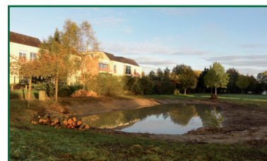
Bassin de rétention

La création de surfaces imperméables en bordures de cours d'eau nécessite des aménagements compensatoires (bassin de rétention, chaussée à structure réservoir, tranchées d'infiltration) afin d'éviter le ruissellement et de limiter la pollution de l'eau.